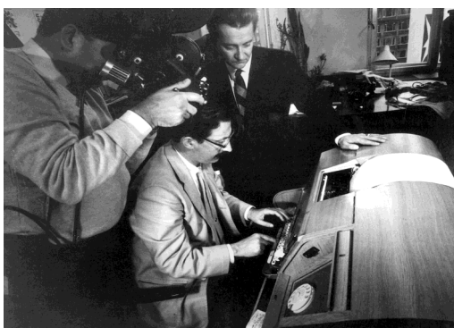
Ao lado, Weizenbaum apresentando Eliza, em 1966. O computador era um mainframe IBM 7090 que não tinha Monitor, cujos textos eram impressos.